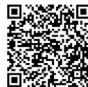
第3回 庄川ウォーキング 特設サイト

第3回目となる庄川ウォーキングは10月19日(土)に開催します。今回は昔から庄川と関わりの深い南砺市(旧井波町)も探索します。この機会に一級河川の庄川に育まれた人々の歴史をのんびり歩いて感じてみませんか? 完歩者には温泉施設の入浴券など特典も盛りだくさん! 申込受付開始は8月下旬からとなります。詳しくは左のQRコードからご覧ください。